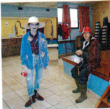
Dans la famille, on est fidèles au carnaval de Bellechaume