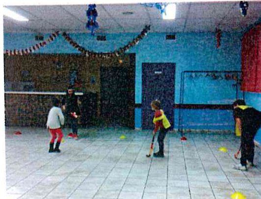
Séance de hockey à l'école multisports de Bellechaume – janvier 2015