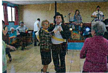
Mister et Miss Choucroute en plein slow 22 nov 2014