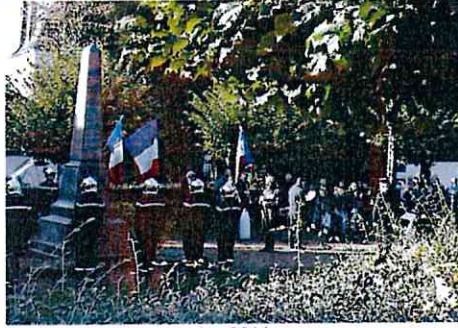
Centenaire du 11 novembre 2014