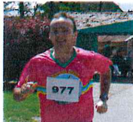
Lors de la course Rond'Yonne

Je ne sors plus que 2-3 fois par mois depuis que je pratique le badminton 2 fois/semaine. Je fais des parcours de 8-10 km surtout dans les bois, c'est bien plus agréable que sur route. Cela permet de me maintenir en forme, et puis j'aime avoir une activité que je peux pratiquer à mon rythme.