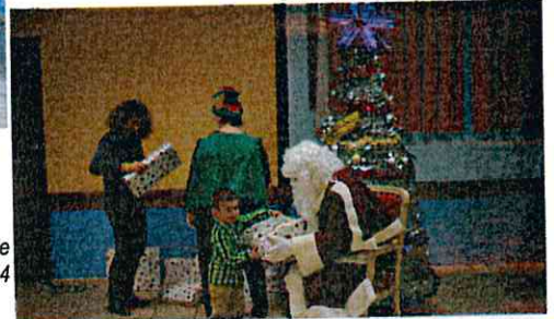
Distribution de cadeaux au goûter de Noël de Bellechaume le 15 décembre 2014