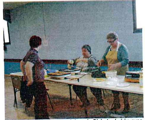
Après-midi crêpes organisé par le Club des Loisirs avec le Carnaval : bien apprécié par les petits et les grands