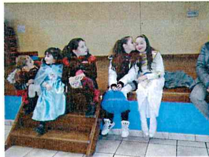
Camaval 28 mars 2015