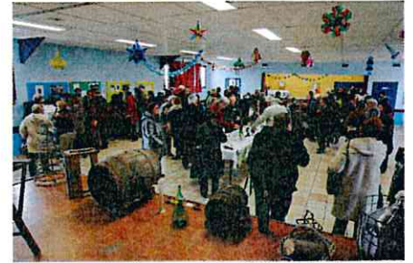
Vin d'honneur de la St Vincent 25 janv 2015