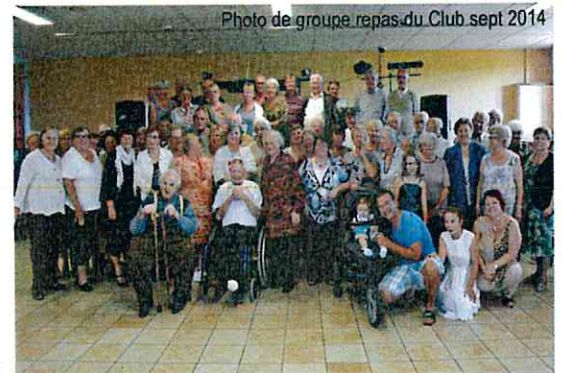
Photo de groupe repas du Club sept 2014