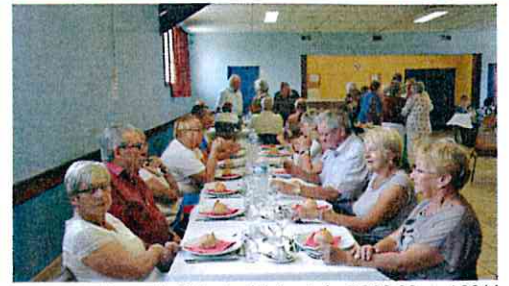
Repas du Club des loisirs et du CCAS 29 sept 2014