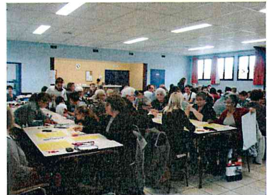
Loto de l'amicale des enfants - oct 2014