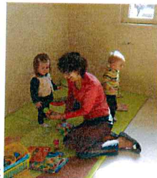
1 er atelier « éveil musical » 23 mars à Venizy

D'abord l'accompagnement et le relais d'information vers les assistantes maternelles agréées. Je les tiens au courant des réglementations, et surtout je les aide dans la mise en place des contrats avec leurs employeurs, les parents. Quelles sont les obligations de chacun, comment déclarer à la caf les heures et les salaires, comment calculer les indemnités mensualisées, la mise en place des congés, etc. Je reçois parallèlement les parents qui le souhaitent pour répondre à toutes leurs questions, les aider à choisir le mode de garde le plus adapté à leur situation. Et j'oriente aussi toute personne qui souhaiterait devenir ass' mat'.