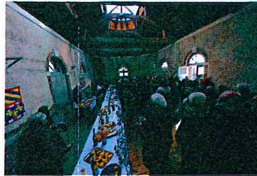
St Vincent 22 janvier 2017