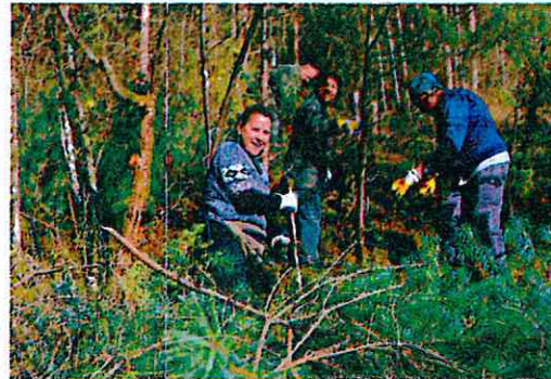
Restauration ZNIEFF Vallée d'Ervaux Décembre 2016