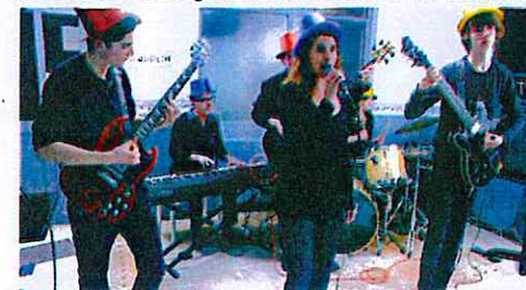
Tournée hivernale école musique 06/02/17