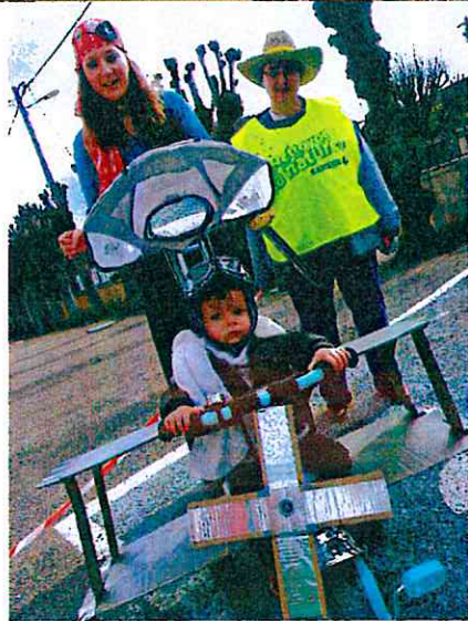
Carnaval 11 mars 2017