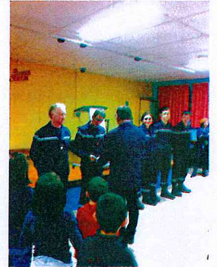
Cérémonie des vœux du Maire 06/01/17 Remise de la médaille d'honneur pompier