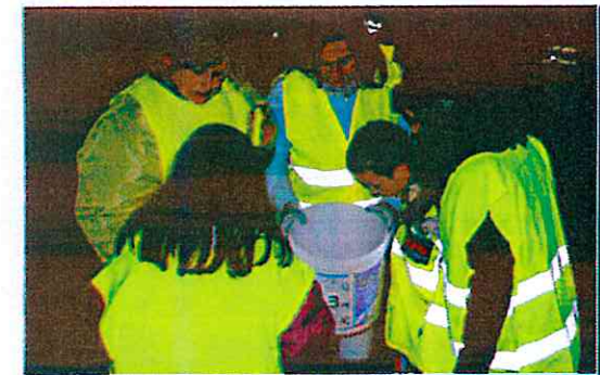
Soirées sauvetage amphibiens - mars 2017