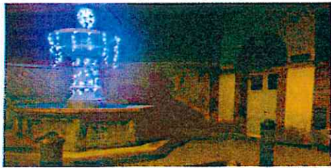
Décorations de rue - Noël 2016