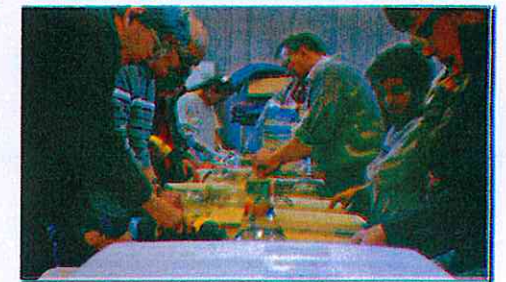
Atelier nids d'hirondelles 11/02/2017