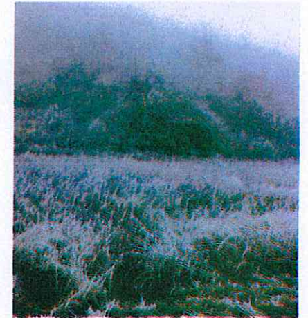
Episode de givre sur Bellechaume fin déc 2016