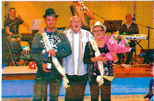
Choucroute du club 22 novembre 2016