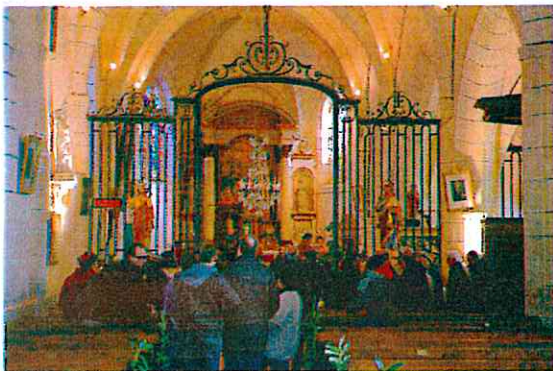
Messe St Vincent 22/01/2017