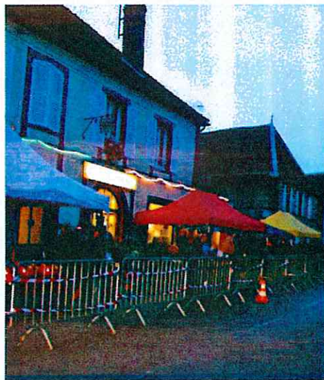
Marché de Noël 19 novembre 2016