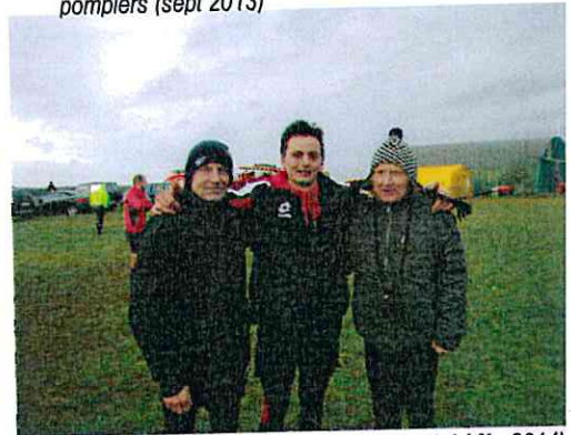
Pompiers volontaires au cross départemental ( fév 2014)