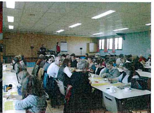
Loto - Amicale des enfants (oct 2013)