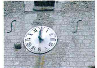
Le remplacement des aiguilles du clocher brisées par le vent est programmé pour mars

Celui-ci sera voté après les élections. Quelques investissements sont malgré tout déjà actés pour cette année, notamment au budget eau / assainissement où le règlement du solde des études préalables aux travaux et les acomptes des travaux eux-mêmes ont été provisionnés. Sur 2013, la réfection du toit du lavoir et l'aménagement de l'aire de loisirs ont été soldés.