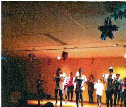
Spectacle du Noel de Bellechaume Amicale des enfants (déc 2013)