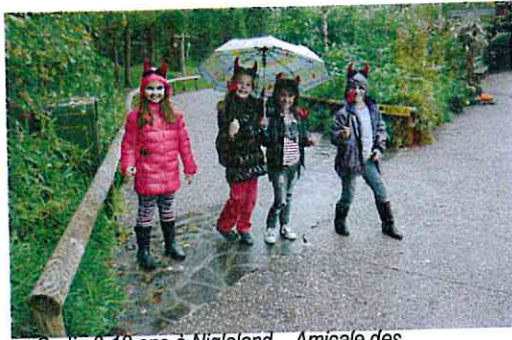
Sortie 8-12 ans à Nigloland – Amicale des enfants (oct 2013)