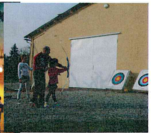
Séance de multisports des 6-12 ans (mars 2014)