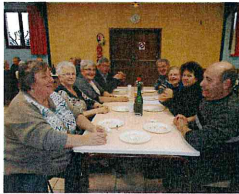
Galette - Club des Loisirs (janv 2014)