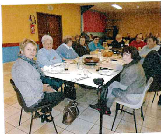
Soirée raclette – Club des loisirs fév 2014)