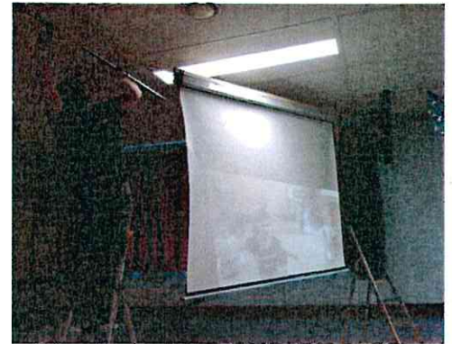
Préparation (acrobatique) du Noel des enfants par les bénévoles de l'Amicale des enfants