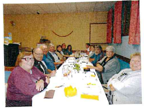
Repas mechoui Feu de la St Jean – Amicale des pompiers (sept 2013)