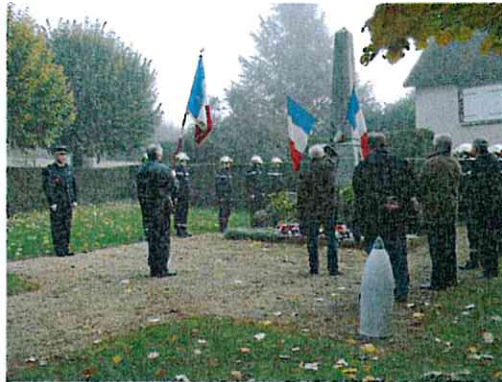
Cérémonie 11 nov 2013