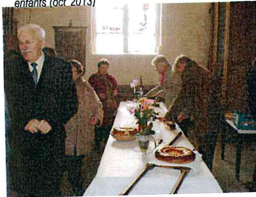
St Vincent à l'église (fév 2014)