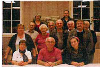
le conseil d'administration réuni

Et une association de plus à Bellechaume ! La petite dernière est dédiée à la collecte et à la mise en valeur des objets, photos et documents qui rappellent et constituent le patrimoine historique du village.