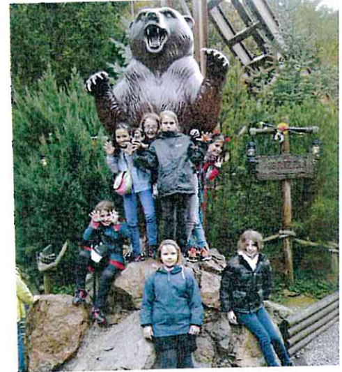
Sortie 8-12 ans à Nigloland (oct 2013) Amicale des enfants