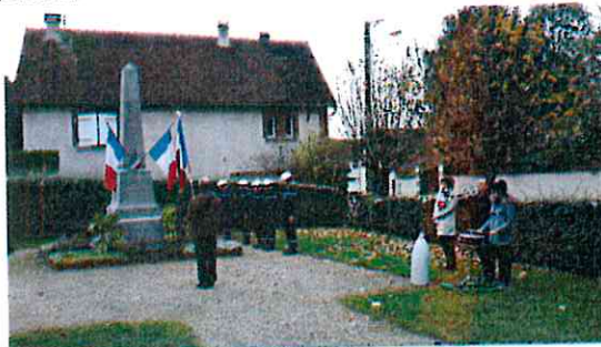
Cérémonie du 11 novembre 2015

Merci à toutes les personnes qui ont aimablement partagé leurs photos de ces événements