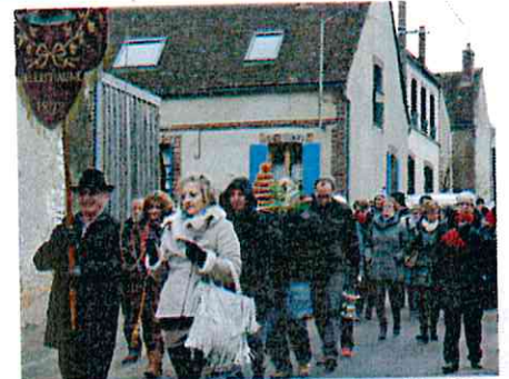
St Vincent 17/01/2016 -Bellechaume, son patrimoine