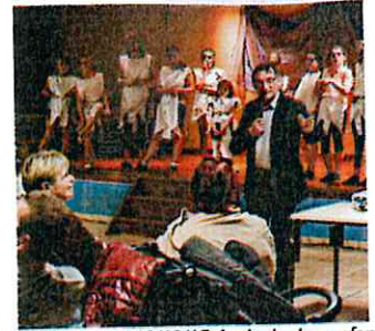
Spectacle Noel 19/12/15 Amicale des enfants