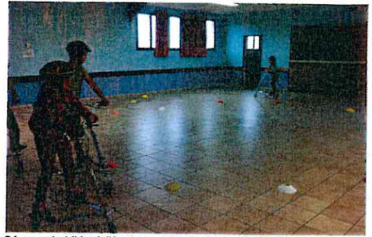
Séance de trikke à l'école multisports (salle des fêtes) mars 2016