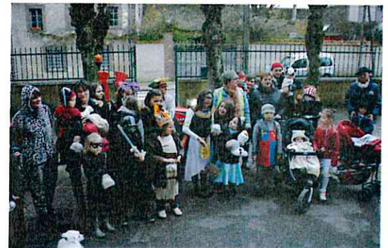
Carnaval 05/03/2016 Amicale des enfants

Associations, particuliers N'hésitez pas à nous transmettre vos photos de Bellechaume A l'adresse : mairie-de-bellechaume@wanadoo.fr