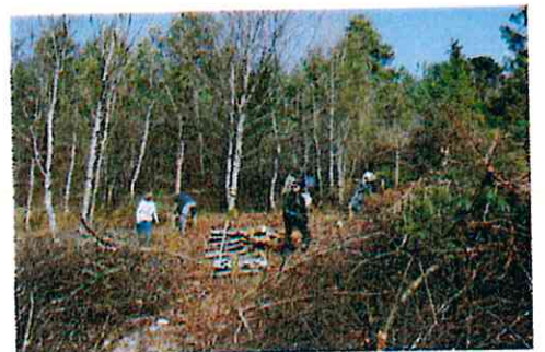
Restauration ZNIEFF vallée d'Ervaux - APNEB