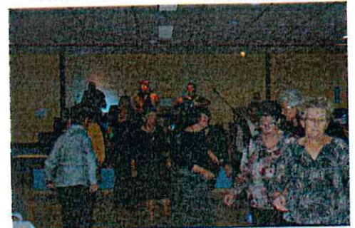
Choucroute 21 novembre 2015 – Club des Loisirs