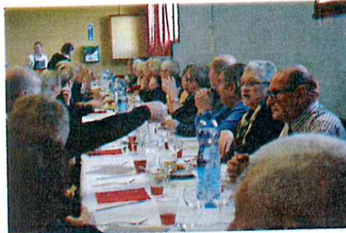
Repas du club des loisirs 27/09/2015