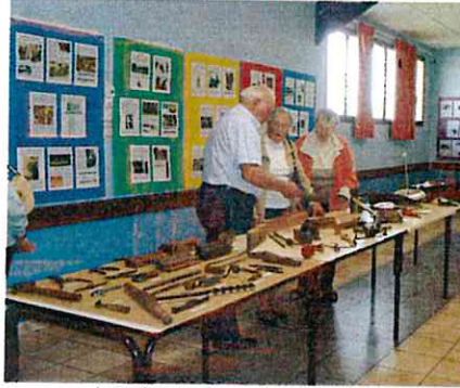
Journées du Patrimoine 2015