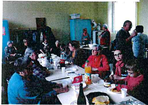
Après-midi crêpes 23/03/2016 - Club des loisirs