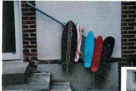
Bellechaume : repaire de skaters