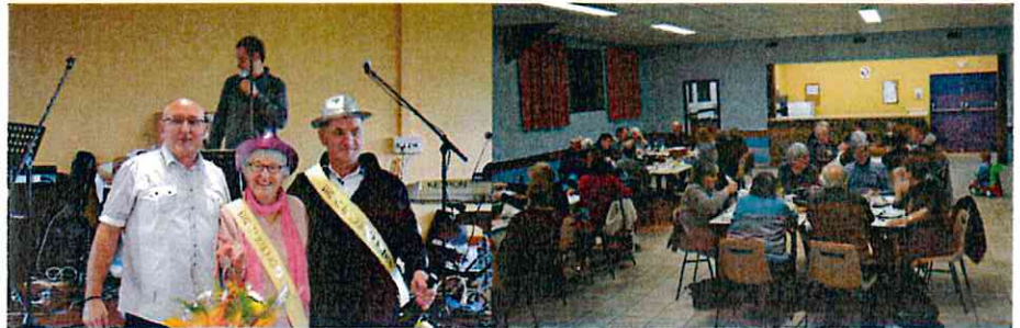
Mister et Miss Choucroute 2015