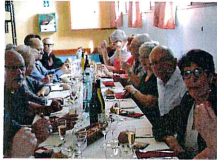
Repas du club et des anciens - 27/09/15