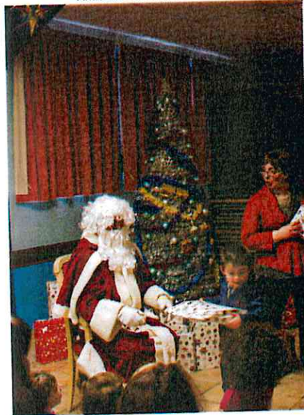
Goûter de Noël Amicale des enfants – 19 décembre 2015