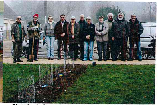
Plantation de 8 ceps de vigne - St Vincent 2016

La seconde édition des Journées du Patrimoine organisée par l'association les 19 et 20 septembre 2015 avait pour thème « Les anciens métiers du village ». Une exposition a été réalisée dans la salle des fêtes avec des panneaux prêtés par l'ADIAMOS 89 et la présentation des recherches effectuées par les membres de l'association expliquant les métiers exercés à la fin du 19 ème siècle par les habitants de BELLECHAUME. Des vieux outils étaient également présentés. Une conférence a été donnée le 18 septembre 2015 sur le sujet par deux membres de l'ADIAMOS 89 : Claude DELASELLE a décrit la crise du phylloxéra qui a ravagé, à partir de 1865, les vignobles français y compris celui de BELLECHAUME et Denis MARTIN a parlé de la ruralité dans le département de l'Yonne de 1870 à nos jours, apogée et déclin. Un jeu de piste avait été organisé dans les rues du village. Il s'agissait de trouver, sur les enseignes apposées sur certaines maisons (anciens artisans et commerces), des mots permettant de reconstituer une phrase.