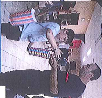
Distribution des drapeaux pour la traditionnelle flambeaux le 13 juillet