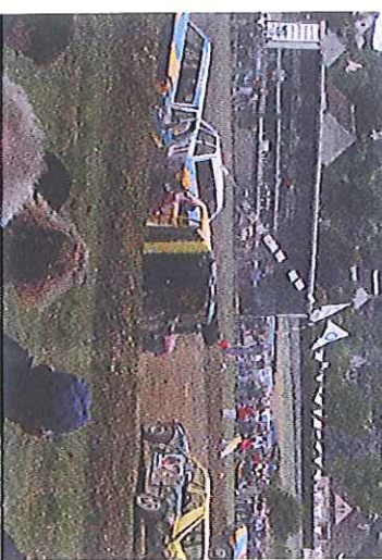
1ers tonneaux spectaculaires pour le Stock car du 17 août