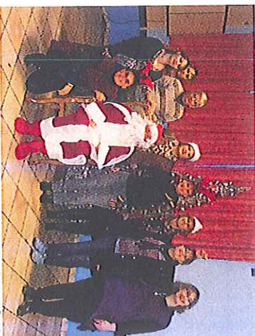
L'équipe de bénévoles de l'amicale des enfants autour du Père Noël