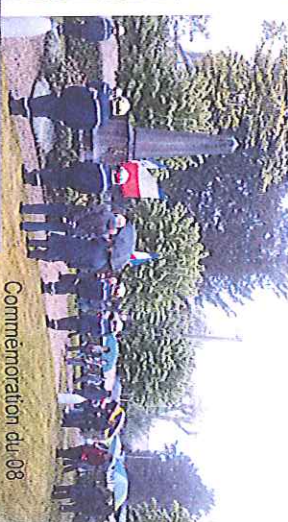
Commemoration du 08 mai au Monument aux Morts