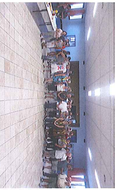
Une partie des bénévoles et des membres du bureau