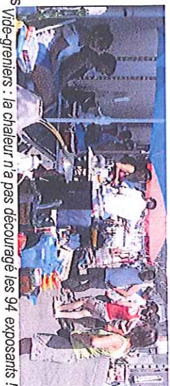
Vide-greniers : la chateur n'a pas découragé les 94 exposants !

Lors des fêtes communales ou associatives, les adhérents donnent volontiers un coup de main mais c'est réciproque. Merci aux uns et aux autres !