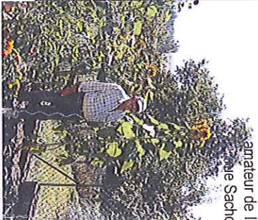
Parasol inattendu de 2,40 m (!) pour ce jardinier amateur de la rue Sachot