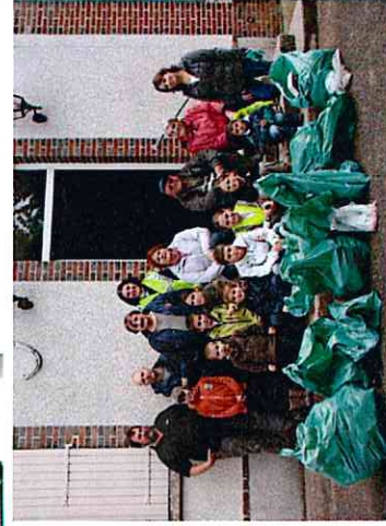
Opération « Nettoyons la nature » le 25 septembre : 18 ramasseurs se sont portés volontaires