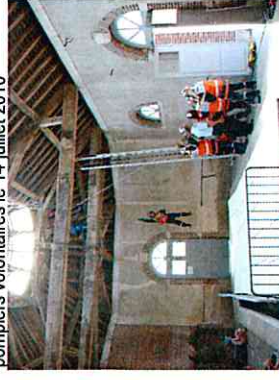
Manceuvre pompiers au lavoir le 14 juillet