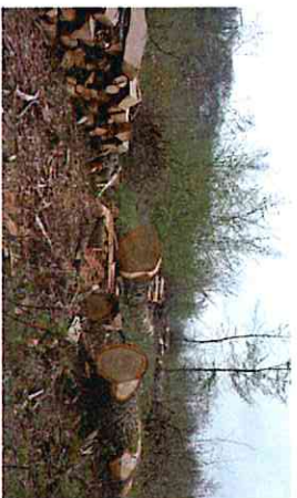
Coupe de régénération parcelle communale n°23

Tout commence en 623 à la mort de St Loup, alors Archevêque de Sens et héritier d'une famille de grands seigneurs de Bourgogne, où tous ses biens sont légués à son successeur à l'Archevêché. Parmi ces propriétés, un vaste territoire boisé qui correspond à l'actuelle forêt domaniale de Courbépine (1) et aux forêts communales actuelles de Briennon et de Bellechaume. Depuis St Loup, un droit d'usage du bois était laissé gracieusement aux habitants pour le chauffage, la construction ou le charbonnage (2). Or, en 1551 un conflit éclate entre les habitants et l'Archevêché qui fait régulièrement des coupes dans cette forêt sans se soucier de ce droit d'usage séculaire et s'insurge justement d'abus de la part des habitants. Il règne en cette époque de guerres de religion un climat de révolte et les habitants de Bellechaume et de Briennon entendent bien défendre leur acquis indispensable à la survie des familles. Antoine Duprat, conseiller du Roi et garde de la Prévôté de Paris est dépêché en personne pour régler le litige et rédige le 27 avril 1552 un acte qui reste à ce jour le seul acte de propriété authentique de nos bois. Il est alors convenu que l'Archevêché cède aux habitants 1100 arpents de la forêt de Courbépine selon une répartition de 8/11 e pour Briennon et 3/11 e pour Bellechaume (proportionnellement à la population des 2 communes).