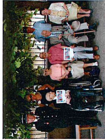
Remise des diplômes d'honneur aux anciens combattants de la 2 ème GM lors de la cérémonie du 14 juillet 2010