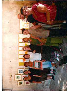
F. Danse accueillait le public pour l'opération Ateliers d'Artistes de l'Yonne du 13 au 15 août 2010