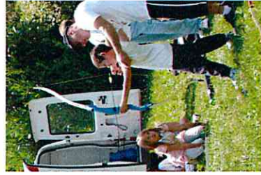
Rencontre intercommunale de L'école multisports de la Région De Briennon le 23 juin 2010