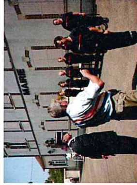
Remise de médaille et de galons aux pompiers volontaires le 14 juillet 2010