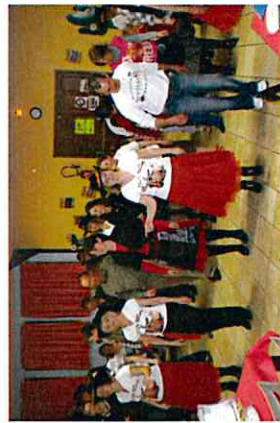
Soirée country à la salle des fêtes le 17 avril 2010 (Amicale des enfants)