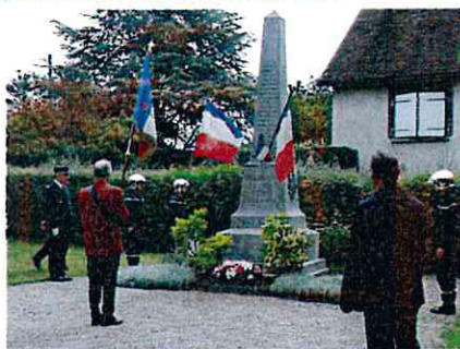
Cérémonie du 08 mai 2015

Un grand merci à toutes les personnes qui ont aimablement partagé leurs photos de ces événements