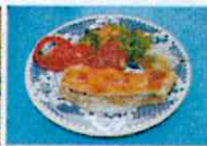
Quelques entrées telles qu'accras,

chictail de morue, de poulet, le feuilleté de poisson, et toute une variété de boudins antillais