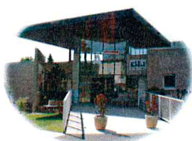
L'hôpital (3 quai de l'hôpital)