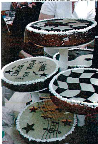
Soirée Noire et Blanche Amicale des enfants - 11 avril 2015