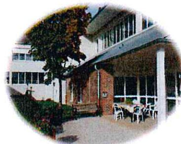
Le centre de gériatrie (1 allée P de Coubertin)