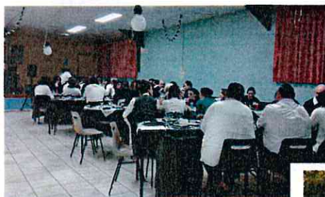
Soirée Noire et Blanche (amicale des enfants) 11 avril 2015

Sortie Parc Astérix (amicale des enfants) 13 sept 2015