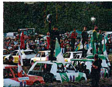
Stock car 22 août 2015