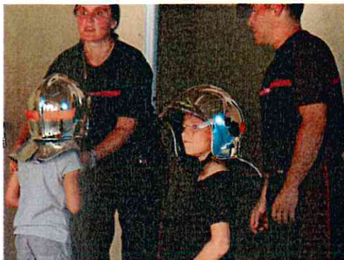
Animation grand public par les pompiers volontaires 14/07/15