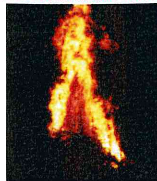
Feux de la St Jean 20 juin 2015