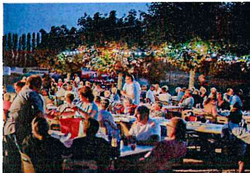
Repas du 13 juillet 2015