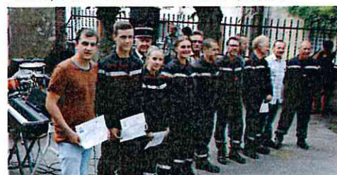
Remise de médailles et diplômes aux pompiers volontaires de Bellechaume 14 juillet 2015