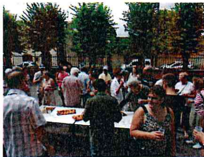
Pot du 14 juillet 2015