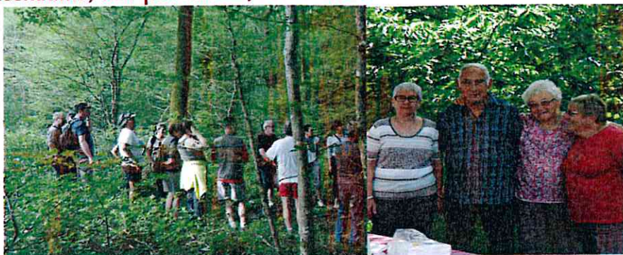
2 ème rando du Patrimoine 14 juin 2015