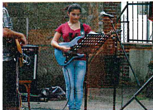
Concert des élèves de l'école de musique du Briennonnais 14/07/15