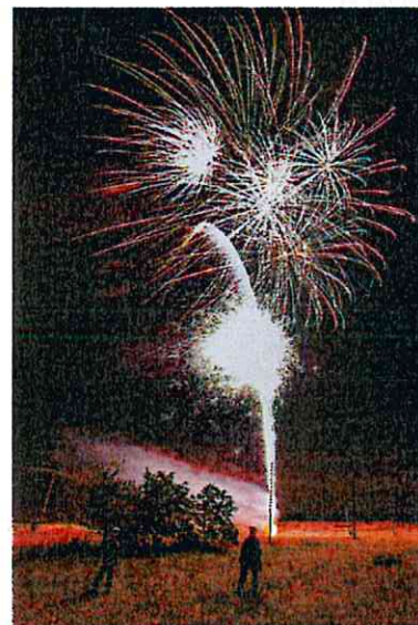
Feu d'artifice 13 juillet 2015