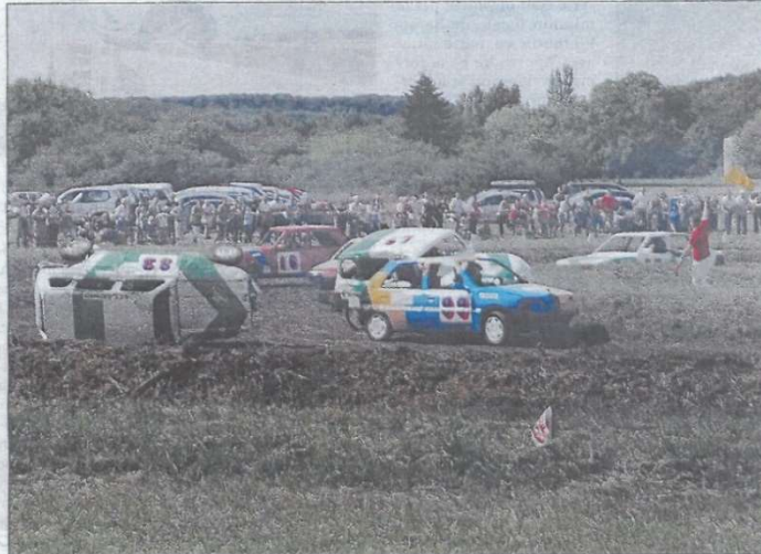
RIVALITÉ. Pas moins de 34 pilotes internationaux seront sur la grille de départ de cette 64 e édition. ILLUSTRATION M. JARLIER

Si l'organisation reste similaire, le contexte, lui, sera bien différent des deux éditions précédentes. « En 2020, nous étions limités à une jauge de 900 personnes. Et l'année dernière, le public devait obligatoirement présenter un pass sanitaire valide. Après, on s'en est plutôt bien